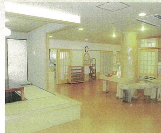
2つのユニットの中心にある掘りごたつ。家と言う居間の役割を果たしています。