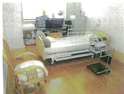
レイアウトは患者の好きなように行えます。

1ユニットをケアの効率、機能から考えて10床規模とし、介護士、看護師を固定配置しました。そしてユニットケアにより院長が考える『らしさのためのケア』が実現しました。1日の過ごし方は患者1人ひとり違い、そこには患者らしさが現れ、それまでの生活歴が現れます。手厚いケアを可能にする個別ケアですが、この個別とは単に1対1で接することだけではなく、患者の生活歴、その人らしさを知った上で初めて行えるケアです。その個別ケアを行うためには、患者が自分を出せる空間となる個室は最適でした。