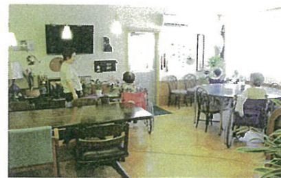
無料喫茶コーナー 子どもたちにはジュース、大人には院長こだわりのコーヒーと、患者や家族のホッと一息つけるスペースを無料ドリンクと一緒に提供しています。

病室は、患者の好きな家具を持ち込み、好きな小物を飾り、好きな音楽をかけ、患者が部屋にあるトイレに気にせず行ける。そして、家族の面会時間も夜9時までと、できるだけ、家族とゆっくり過ごしてもらう時間を設定できるのも個室だからです。院長はこの病室を「自宅ではない在宅」と位置付けます。